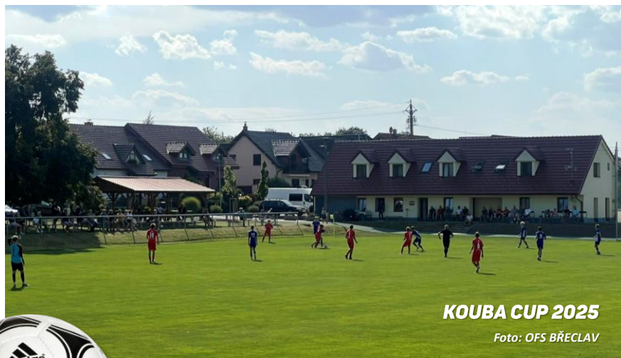
KOUBA CUP 2025