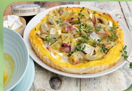
pizza s artyčkem

nutí se uloží do chladna, ale ne do chladničky. Užívá se 3x denně jedna polévková lžice po dobu 15 dní, pak se udělá 14 dní přestávka a opět se 15 dní užívá. Celá kúra trvá 44 dní.