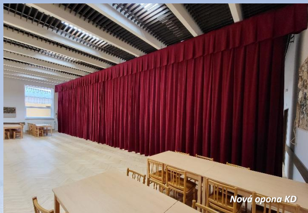
Nová opona KD