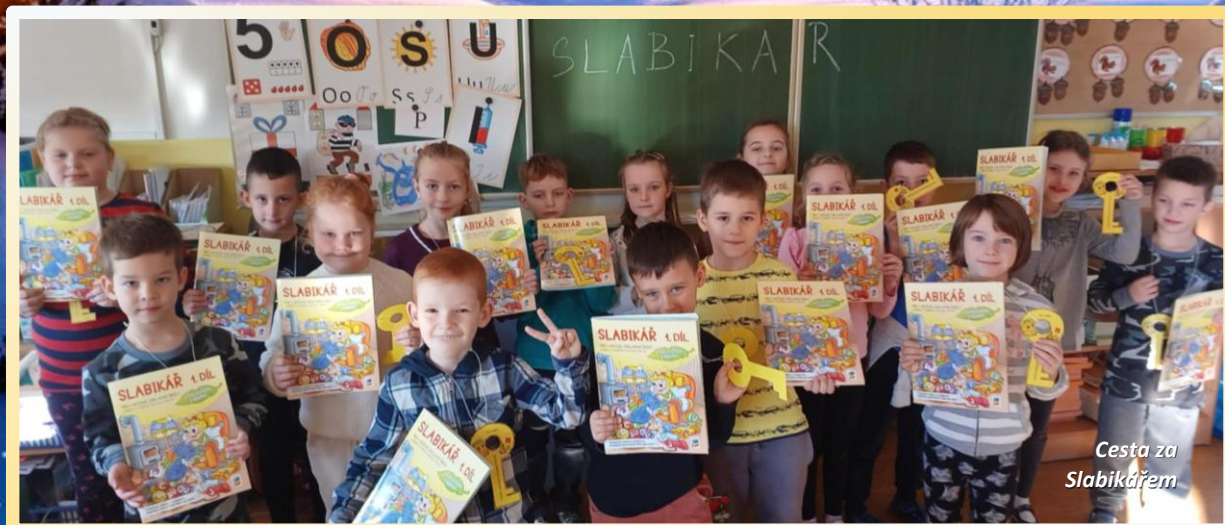
Cesta za Slabikářem