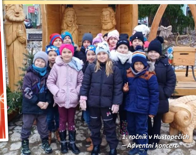
1. ročník v Hustopečích – Adventní koncert

Děkujeme za podporu a spolupráci v uplynulém roce a těšíme se na všechna společná dobrodružství v tom nadcházejícím.