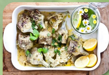
pečené artyčoky a la Romana

Velmi oblíbené jsou také nakládání artyčoky. Nakládají se do oleje nebo slaného nálevu s bylinkami a česnekem, čímž získávají ještě zajímavější chuť.