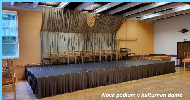
Nové podium v kulturním domě