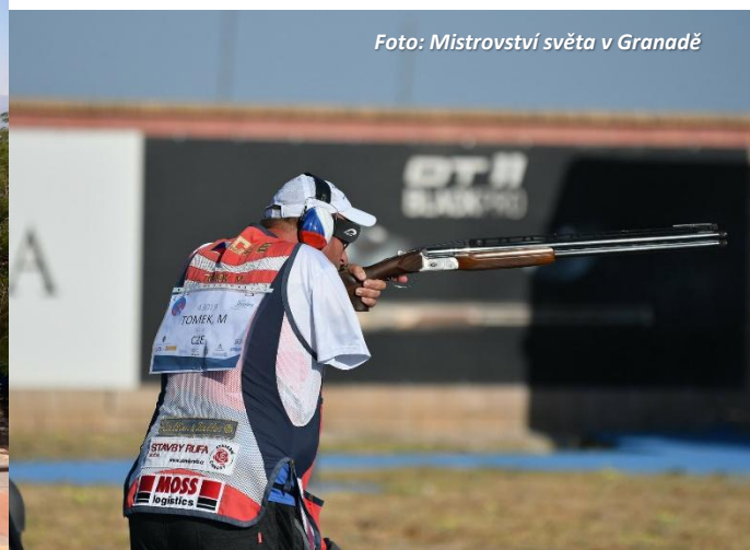
Foto: Mistrovství světa v Granadě