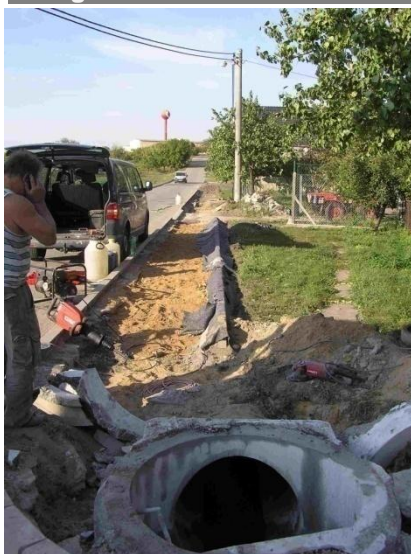
foto: budování chodníku na Objížďce

Foto na první straně: velká a malá - hodový krojový průvod, malá-dýňová výzdoba rodiny Kadrnků a Lesnerů.