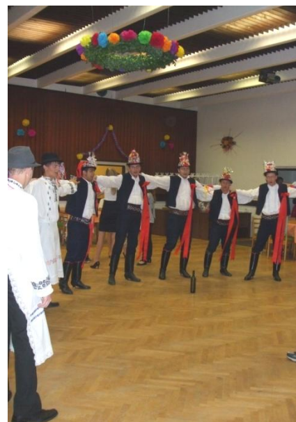
foto: sál KD, HODY 2011

Tento sazebník je platný od 1.1. 2009, tímto se ruší dříve platné sazby za pronájem KD. Schváleno ZO dne 23.1.2009.