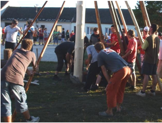
Hody 2011 - stavění máje