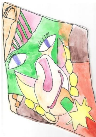
obrázek namaloval Jakub Havlík