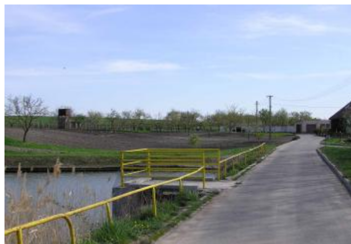
V prostoru bývalé Školní zahrady je místo pro 3 rodinné domky.