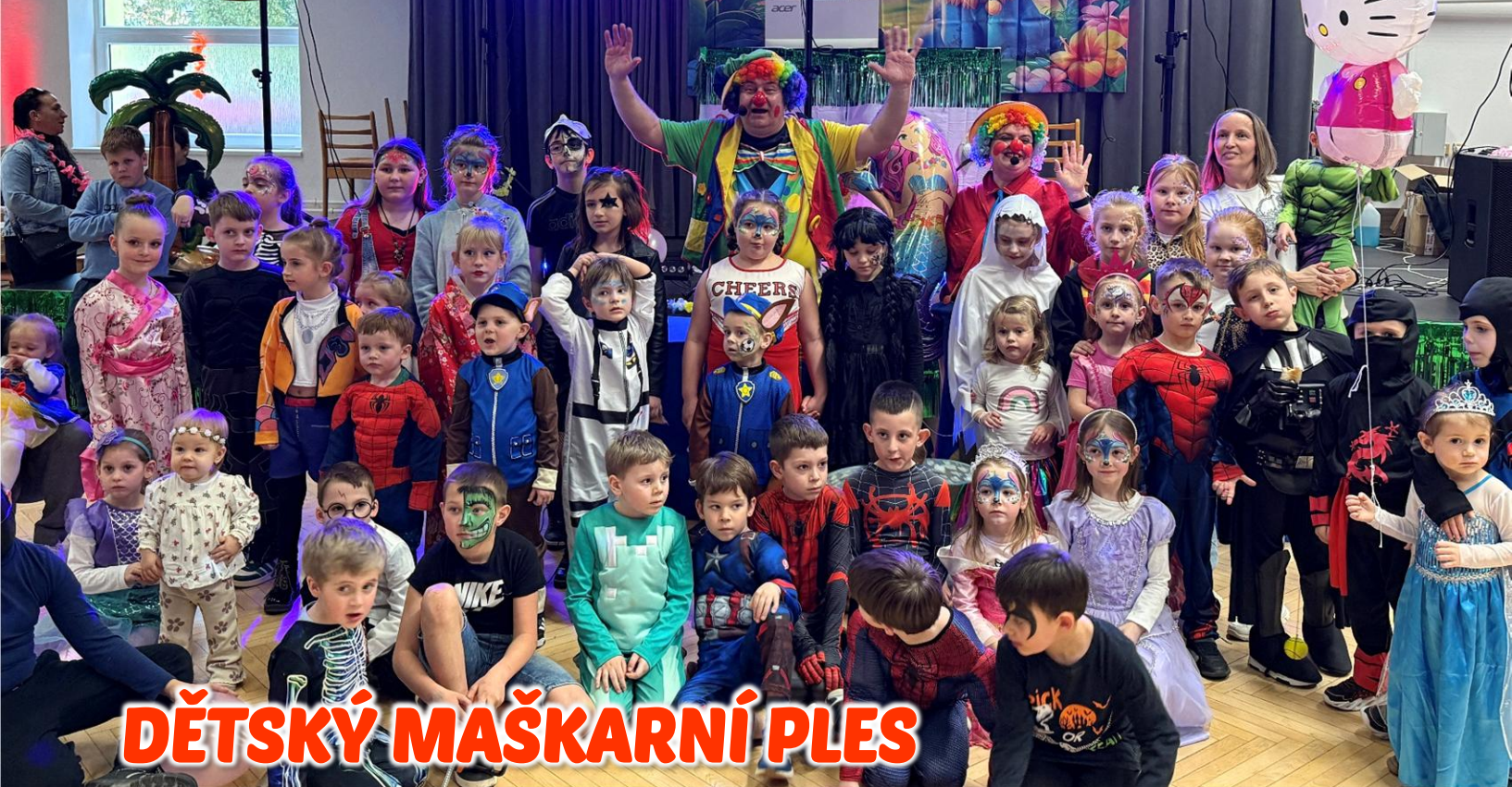
DĚTSKÝ MAŠKARNÍ PLES