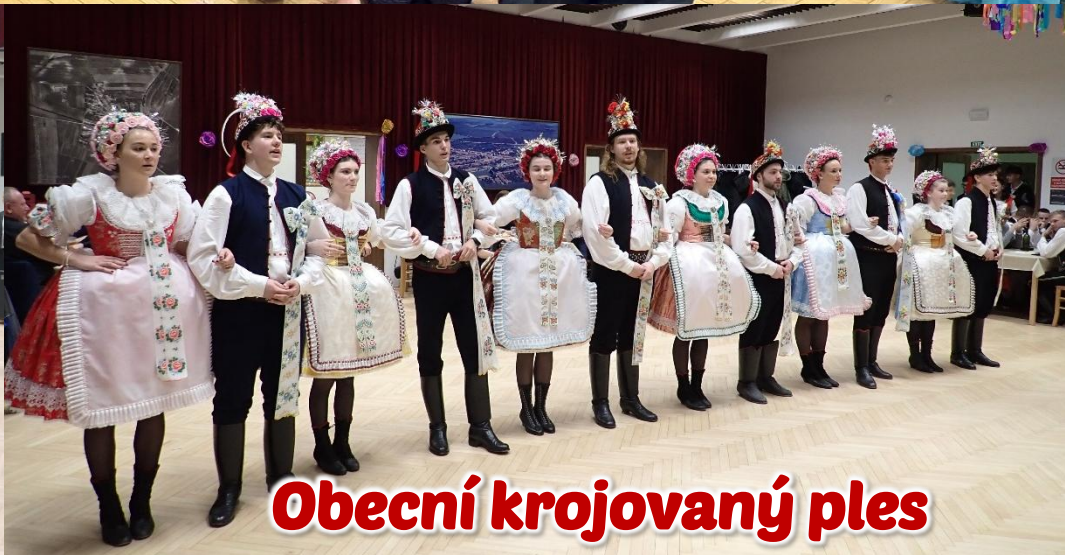
Obecní krojovaný ples