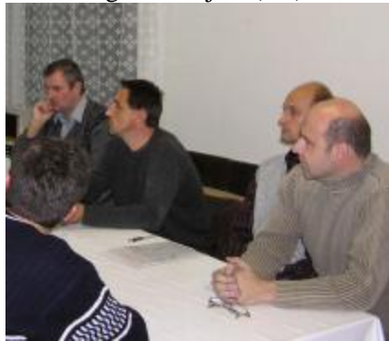
Ze zasedání obecního zastupitelstva