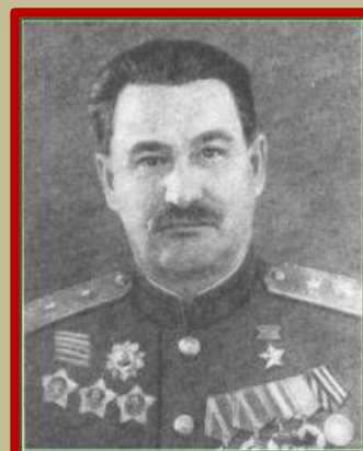
Generálporučík tankových vojsk Fedor Grigorjevič Katkov , velitel 7. mechanizovaného sboru (obr. vpravo)