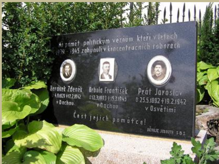
Pamětní deska u pomníku padlých připomíná obyvatele obce, kteří zahynuli v německých koncentračních táborech.

Válka si vyžádala kromě ohromných hospodářských ztrát i miliony mrtvých, jak na bojištích, tak i v koncentračních táborech. Bolestně poznamenala každého. Ne všichni se vrátili do svých domovů a ne všem bylo dopřáno radosti ze shledání se svými blízkými.