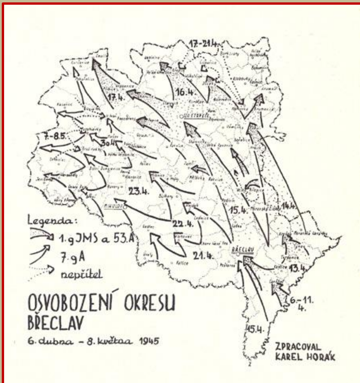
Situace na Břeclavsku v období od 6. dubna do 8. května 1945. (Zdroj: Horák Karel: Rudá armáda na Břeclavsku, OKS Břeclav 1975)