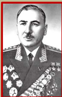
Generálporučík Issa Alexandrovič Plijev , velitel 1. gardové jezdecko-mechanizované skupiny vojsk (obr. vlevo)