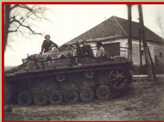
Ještě několik let po válce se na katastru obce nacházely vraky zničené vojenské techniky Snímek vlevo: , snímek vpravo – německý tank u hřbitova