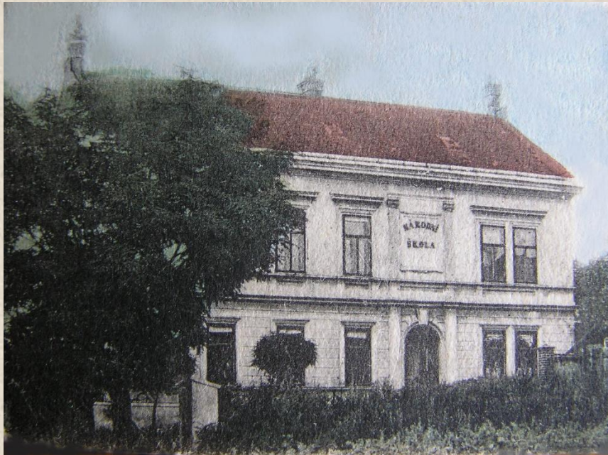
Nová budova Národní školy byla ve Starovičkách postavena v roce 1884.

1884 Na místě původní jednotřídní školy byla postavena nová školní budova, slavnostně uvedená do provozu v neděli 21. září 1884.