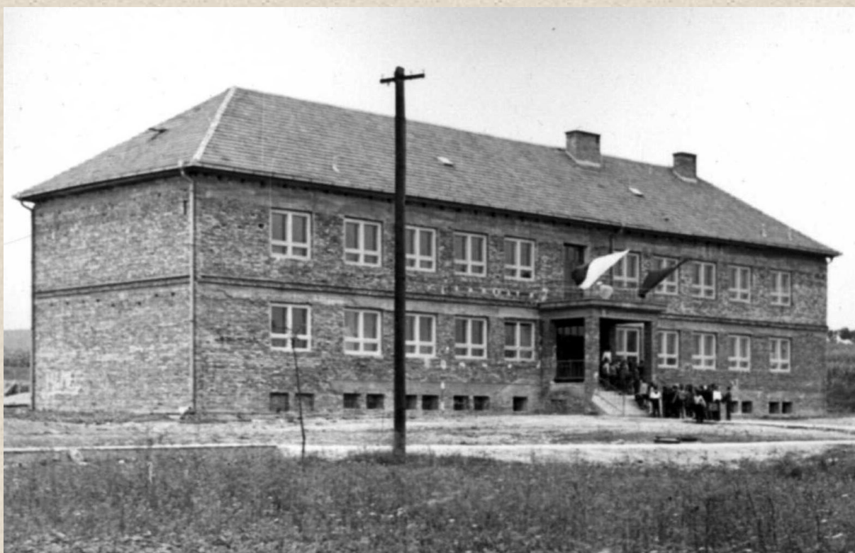
30. srpna 1964 - do provozu byla slavnostně uvedena nově postavená školní budova.

1964 Dne 21. června ve 4 hodiny ráno zasáhla obec silná bouře. Následkem přívalového deště byla protržena hráz na Luži a valící se voda vnikla do domku Aloise Kostrhouna č. 124. Voda zatopila také louky pod dědinou.