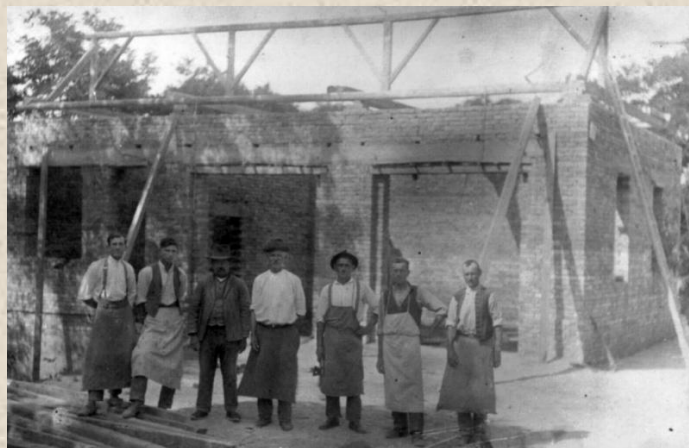
Výstavba „Hasičského domu“, obrázek z roku 1928

1929 Dne 22. září uvedl Místní sbor dobrovolných hasičů do provozu nově postavený „Hasičský dům“.