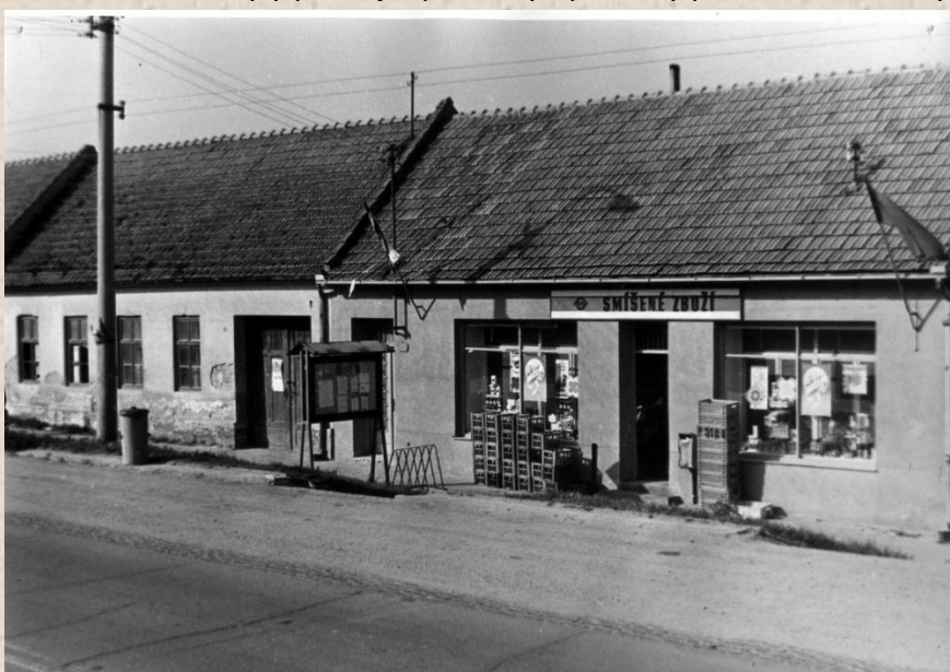
Prodejna Potravin a smíšeného zboží Jednoty byla vybudována v obci v roce 1958

1958 Jednota uvedla do provozu nově postavenou prodejnu potravin a smíšeného zboží. Koncem roku 1960 byly prodejní prostory upraveny pro samoobslužný prodej.