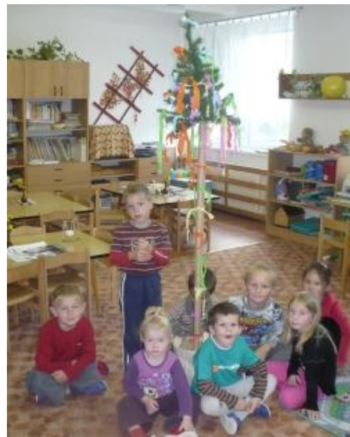
foto: děti ve školce pod májou a nácvik tance