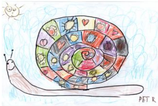
nakreslil : Petr Zeman 1. tř