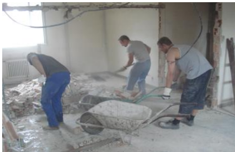
foto: odklizení demoliční suti, prostor po demolici zdiva a stavebních úpravách

Teď už zbývá jen pár posledních úprav a snad už v listopadu bude klubovna připravena pro všechny se zájmem udělat něco pro své zdraví, postavu a kondici. Michal Spěvák