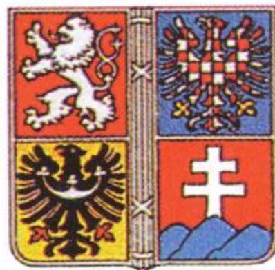
přehlídka rot 7. střeleckého pluku s generálem Gajdou v květnu 1918 první státní znak po r. 1918