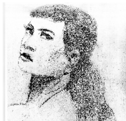
nakreslila Antonie Nečasová